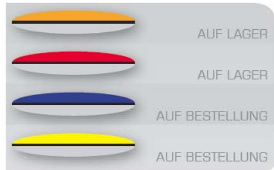
Farbkombinationen Ober- und Untersegel, mit Designstreifen

Die Charakteristik des UP Kuna – hohe Sicherheit in Verbindung mit progressivem, differenziertem Handling und guten Leistungswerten – macht den Schirm auch für Piloten interessant, die nach ihrer Ausbildung nur wenig Zeit zum Fliegen haben oder schon länger nicht mehr geflogen sind. Kurzum für alle Piloten, die entspanntes und müheloses Flugvergnügen suchen und dabei ein Maximum an Sicherheit fordern.