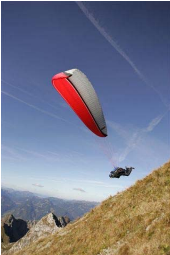
Dynamischer Start - die UP Testpiloten sind begeistert von dem spielerischen Startverhalten

Sie wissen wohin Sie wollen? Dann ist es an der Zeit zu Starten - und das ist mit dem Kantega 2 ein Kinderspiel. Bereits während der Entwicklung zeichnete sich ab, dass die Prototypen ein außergewöhnlich gutes Startverhalten