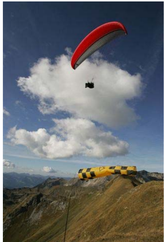
Kantega 2 – UP's sportiver Allrounder bietet Flugspaß pur

Wendig und agil beim Soaren am Hang und mitreißend sportlich auf freier Strecke.